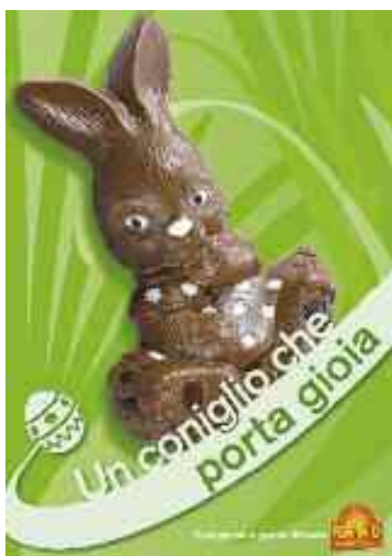
Pasqua, 4 aprile