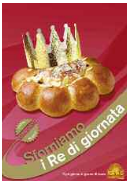
Re Magi, 6 gennaio