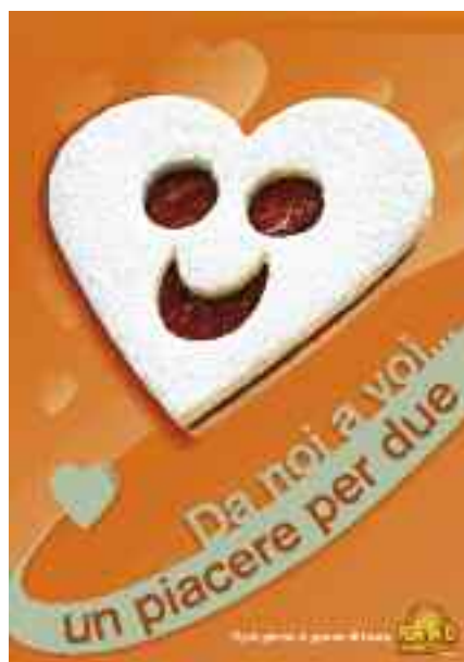
San Valentino, 14 febbraio