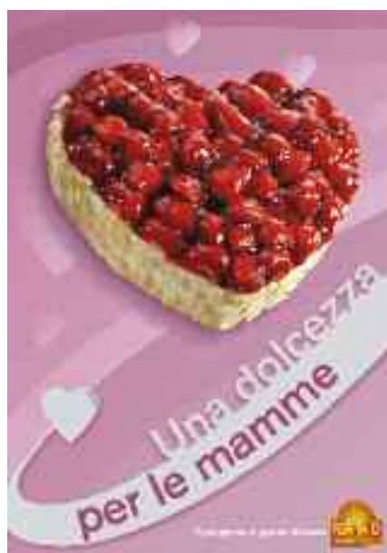
Festa della mamma, 9 maggio